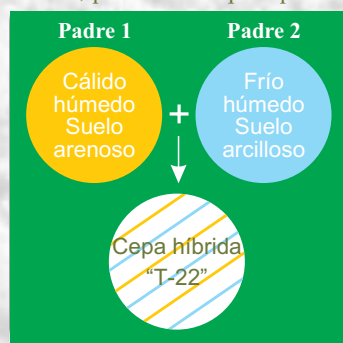
Figura 1. Cruza de 2 cepas T. harzianum , por fusión de protoplastos

La Cepa T-22 ha sido desarrollada por la Universidad de Cornell mediante una cruce de dos cepas de Trichoderma harzianum provenientes de regiones de climas y suelos contrastante (Figura 1), lo cual le confiere propiedades sobresalientes de adaptación a un amplio rango de especies (probada en más de 2000 especies de plantas silvestres y cultivadas), suelos (de arenosos a arcillosos), climas (fríos-templados y cálido húmedos) y pHs (4-8).